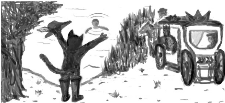
Skizze aus einer Redaktionssitzung

Und was passiert nun? Zunächst einmal passiert eben das nicht, was er immer befürchtet hatte, nämlich, dass es ihn schlimm treffen werde, wenn er sich gottvertrauend auf eine offene Sache einließe (wie mit der Erbschaft). Er wird nicht das Opfer von irgendetwas Schlimmem! Er hat also nicht den Schwarzen Peter in der Hand. Das ist der eine Teil der neuen Erfahrung. Es passiert aber noch etwas Wichtigeres,